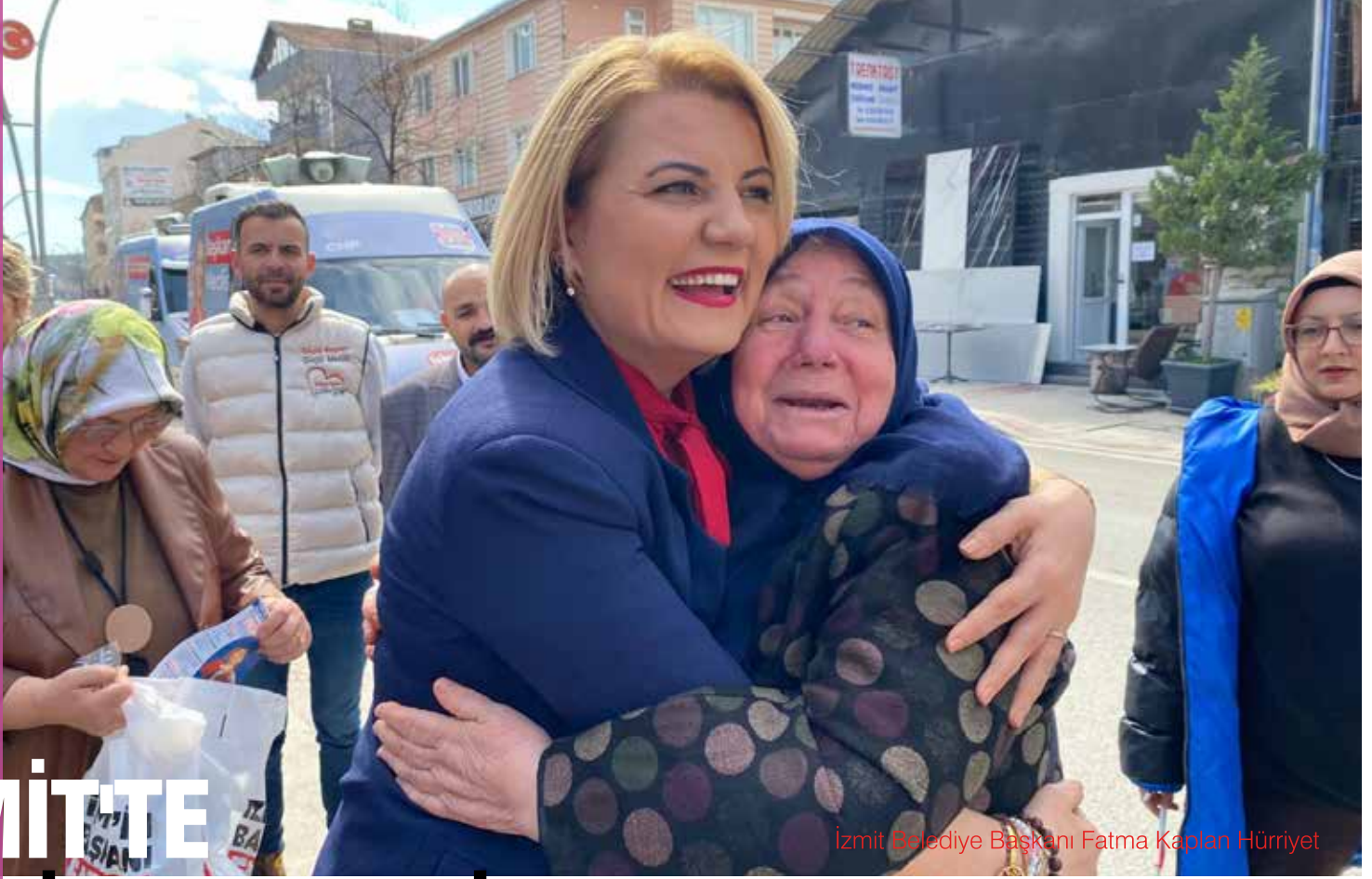
İzmit Belediye Başkanı Fatma Kaplan Hürriyet