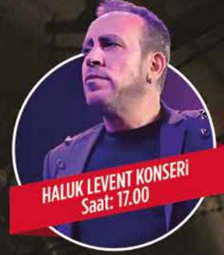
HALUK LEVENT KONSERİ Saat: 17.00